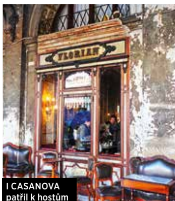
I CASANOVA patřil k hostům zdejšího Caffé Florian!