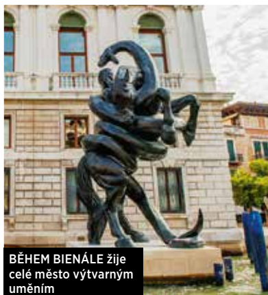
BĚHEM BIENÁLE žije celé město výtvarným uměním