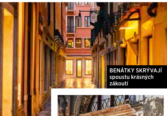
BENÁTKY SKRÝVAJÍ spoustu krásných zákoutí