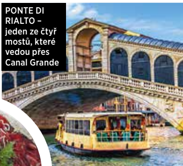
PONTE DI RIALTO – jeden ze čtyř mostů, které vedou přes Canal Grande

Určitě vás zaujme i zajímavé propojení historie a současnosti, které se podařilo japonskému architektovi Tadau Andóovi, jenž byl rekonstrukcí původního objektu hlavní celnice pověřen. Majitelem objektu není nikdo jiný než francouzský sběratel, miliardář (a taky manžel herečky Salmy Hayek) Francois Pinault. Patří mu rovněž další benátské muzeum – Palazzo Grassi, kde se nachází jeho vlastní sbírka