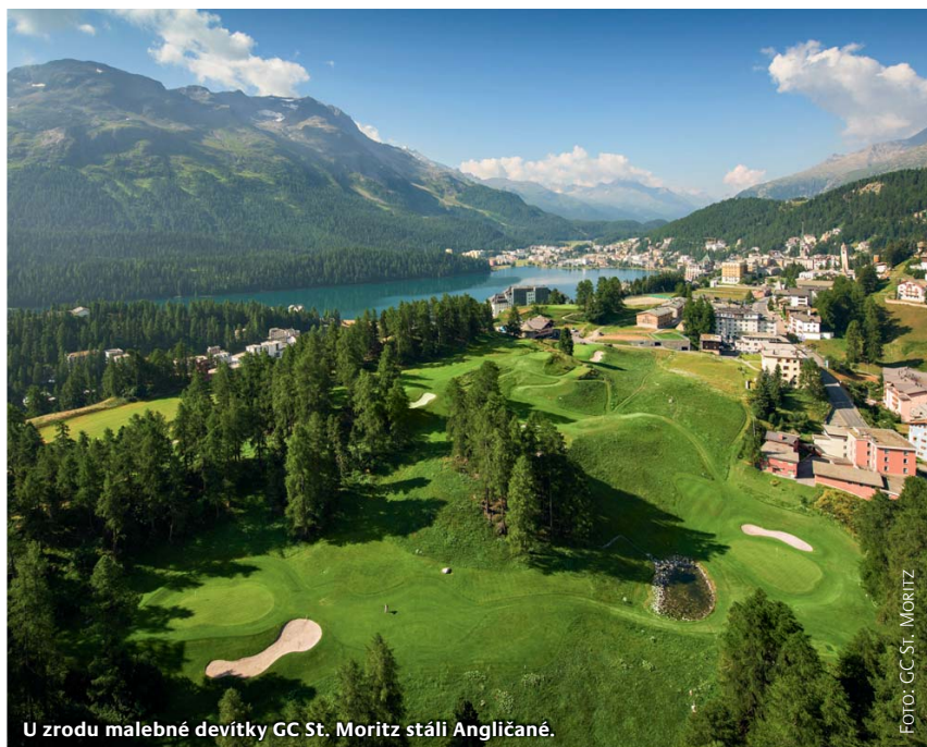
U zrodu malebné devítky GC St. Moritz stáli Angličané.