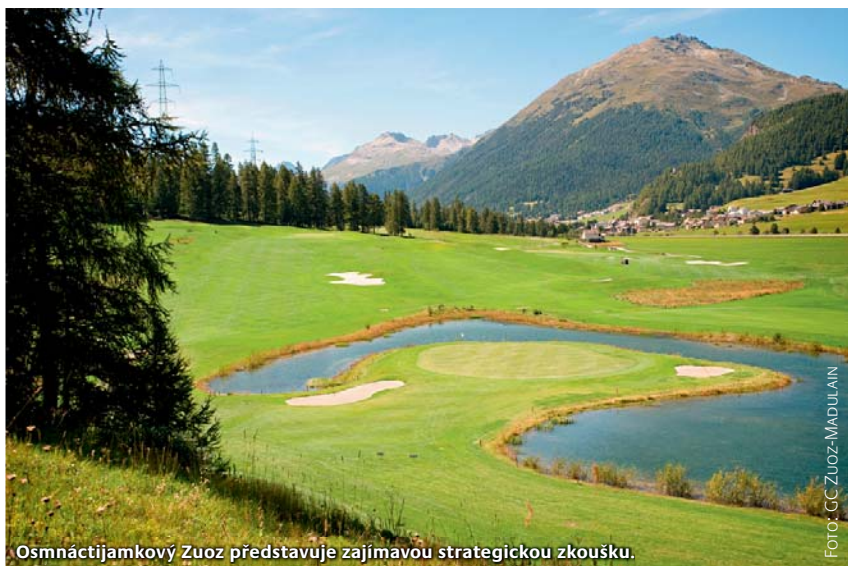
Osmnáctijamkový Zuoz představuje zajímavou strategickou zkoušku.

Tenkrát trvala cesta z Londýna do Svatého Mořice několik dnů. Anglická partička si přesto dala říct. Přijeli na Vánoce na saních tažených koňmi a zjistili, že hoteliér měl pravdu. Sáňkovali, hráli kriket a závodili na koních na jezeře, a tak zde položili základy zdejšího sportování.