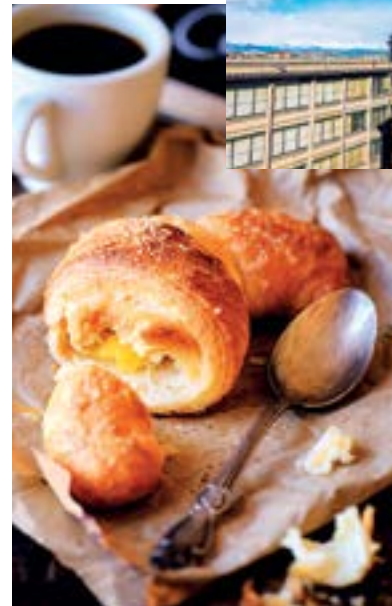
GALERIE manželů Agnelli je velkolepým příkladem průmyslové architektury. Jde o bývalou výrobní halu.

TEXT: NATÁŠA KAMES; FOTO: SHUTTERSTOCK.COM (7) A ARCHIV TURIN PALACE HOTEL (1)