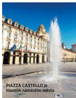
PIAZZA CASTELLO je hlavním náměstím města