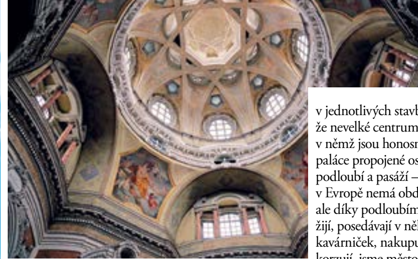
HLAVNÍ KUPOLE kostela San Lorenzo nezapře vliv španělské muslimské architektury