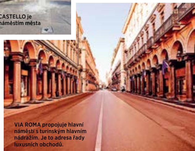
VIA ROMA propojuje hlavní náměstí s turínským hlavním nádražím. Je to adresa řady luxusních obchodů.

TEXT: NATÁŠA KAMES; FOTO: SHUTTERSTOCK.COM (7) A ARCHIV TURIN PALACE HOTEL (1)