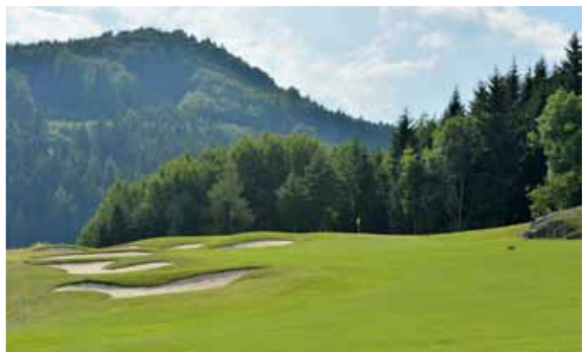
HLAVNÍ FOTO: Adamstal v plné kráse